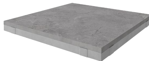
DuoProCeram 2Drive 60x60x5 cm

Dane z karty produktu należy traktować wyłącznie jako ogólne wskazówki. DUOPRO CERAM 2DRIVE jest wyrobem wyprodukowanym z surowców naturalnych. Należy uwzględnić pewne odchylenia parametrów wyrobu wynikające ze zmienności surowca naturalnego. Poza informacjami zawartymi na opakowaniu należy przestrzegać zasad sztuki budowlanej, norm krajowych oraz europejskich, wytycznych instytutów i stowarzyszeń branżowych oraz przepisów BHP. Ze względu na brak wpływu na warunki pracy i różnorodność materiałów informacje zawarte w karcie nie mogą stanowić podstawy do rozszczeń. W przypadku wątpliwości zalecane jest przeprowadzenie własnych prób. Firma Crusil udziela gwarancji jedynie co do niezmiennej jakości swoich produktów.